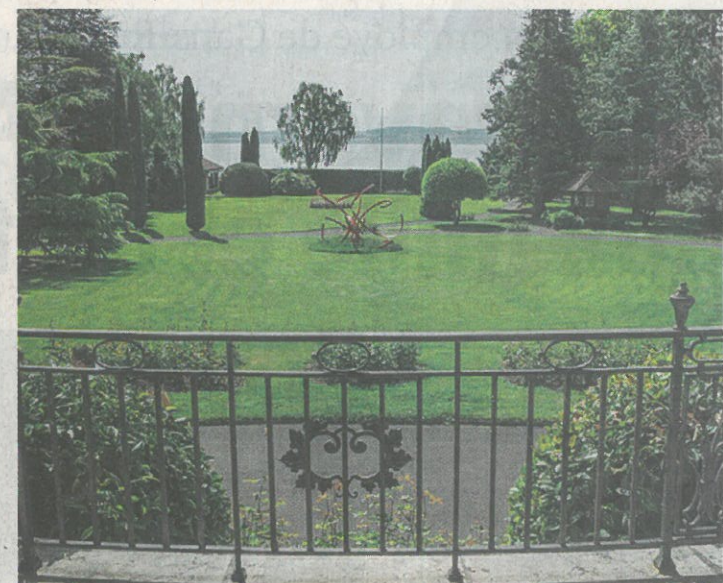
Le projet Ensemble Gouttes-d'Or présenté par les intervenants prévoit de confier l'exploitation de la Villa Perret à l'hôtel Palafitte. Le jardin serait transformé en parc public avec un restaurant au bord du lac. CHRISTIAN GALLEY