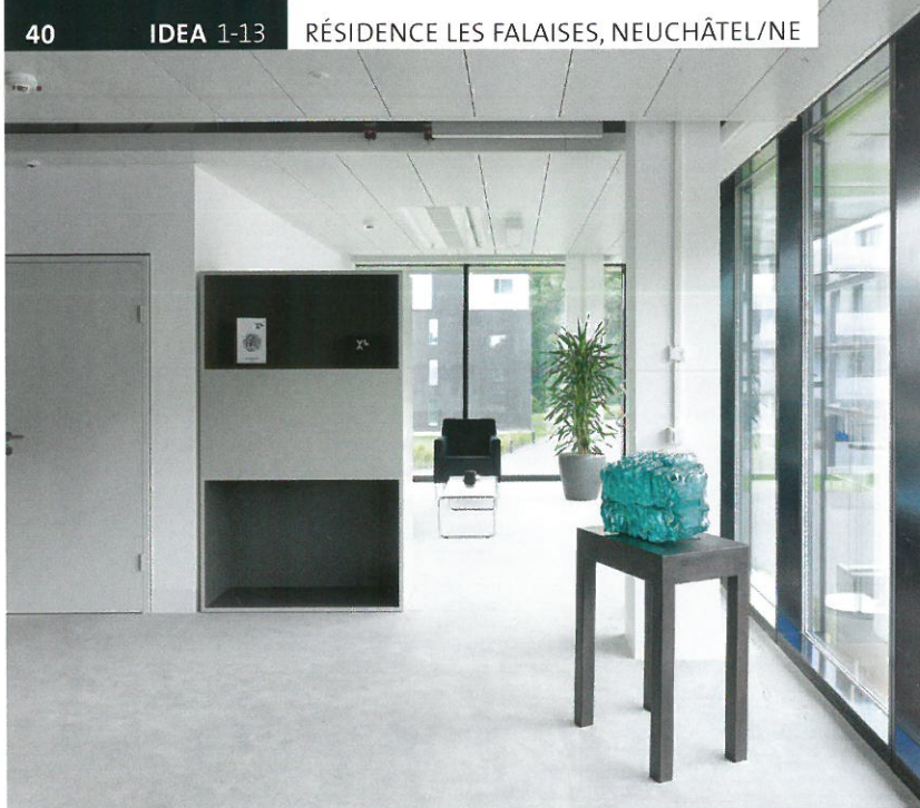
Les locaux de bureaux disposent d'un agréable confort.