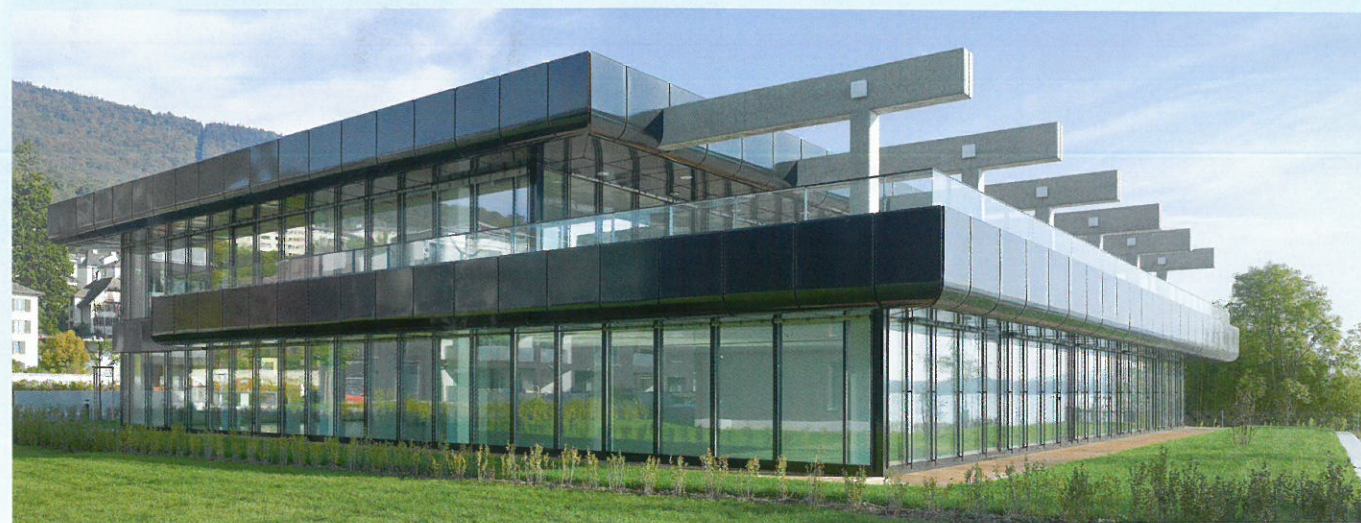
Le bâtiment de bureaux ci-dessus et les immeubles d'habitations à gauche forment un nouveau quartier atypique.

Sur les rives du lac de Neuchâtel se trouve un complexe comprenant cinq immeubles d'habitations et un bâtiment de bureaux planifié par le bureau Manini Pietrini de Neuchâtel. Jouissant d'un emplacement exceptionnel, ce nouveau quartier allie intimité et zones de rencontre.