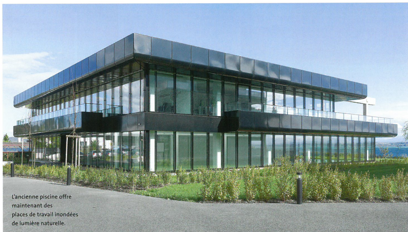
L'ancienne piscine offre maintenant des places de travail inondées de lumière naturelle.