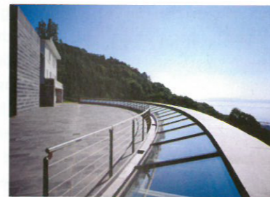
10 Centre Dürrenmatt Standort: Rue Pertuis-du Sault 74 Bauherrschaft: Schweizerisches Literaturarchiv, Schweizerische Landesbibliothek, Bundesamt für Kultur Architekten: Mario Botta, Lugano Bauingenieur: Nicolas Kosztics, Neuchâtel Bauleitung: Arrigo & Urscheler, Neuchâtel Vorstudien: 1992, Projekt: 1995–1997 www.cdn.ch