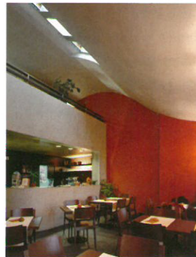
4 Café de la Collégiale Standort: rue de la Collégiale 10a Bauherrschaft: République et canton de Neuchâtel Architekt: Riccardo Chieppa, Marin Bauingenieur: Vincent Becker, Neuchâtel Projekt: 2001, Ausführung: 2002