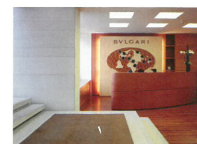
17 Immeuble Bulgari Standort: Rue de Monruz 34 Bauherrschaft: Bulgari Time SA Architekten: Atelier d'architecture Manini Pietrini, Neuchâtel Ausführung: 2000