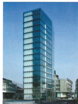
9 Turm Bundesamt für Statistik Standort: Espace de l'Europe 10 Bauherrschaft: Bundesamt für Bauten und Logistik BBL Architekten: Bauart Architekten und Planer AG, Bern/Neuchâtel; Mitarbeiter: Yorick Ringeisen und Patrick Remund Bauingenieur: GVH Saint-Blaise, Pierre Gorgé Wettbewerb: 1990, Ausführung: 2000–2003