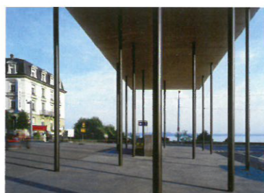
8 Couvert de la gare CFF Standort: Place de la Gare Bauherrschaft: Parking de la Gare de Neuchâtel Architekten: Geninasca Delefortrie, R.-E. Monnier, Neuchâtel; Mitarbeiter: J. Affolter, D. Ferrat Bauingenieur: Mauler SA, Peseux Ausführung: 2001–2002