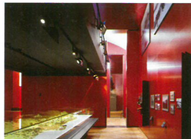
7 Galeries de l'histoire Standort: Avenue du Peyrou 7 Bauherrschaft: Ville de Neuchâtel Architekten: Atelier d'architecture Manini Pietrini, Neuchâtel Bauingenieur: N. Kosztics, Neuchâtel Ausführung: 2001–2002 www.mahn.ch/ghn