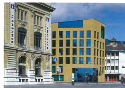
5 Migros Bank Standort: Faubourg du Lac 12 Bauherrschaft: Migrosbank, Zürich Architekten: Geninasca Delefortrie, Neuchâtel; Projektleiter: J.-M. Deicher; Bauleitung: S. Rüfenacht; Mitarbeiter: D. Ferrat, H.-P. Reichenbach Bauingenieur: GVH, Saint-Blaise Wettbewerb: 2002, Ausführung: 2003–2005