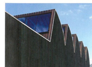
14 Halle de sport de la Riveraine Standort: Rue du littoral 1 Bauherrschaft: Ville de Neuchâtel Architekten: Geninasca Delefortrie, Neuchâtel; Projektleiter: J.-M. Deicher; Bauleitung: P. Bernasconi; Mitarbeiter: D. Ferrat, V. Mathez Bauingenieur: AJS ingénieurs civils SA, Neuchâtel; Ingenieur Holz: Chabloz et partenaires SA Wettbewerb: 1998, Ausführung: 2003–2005