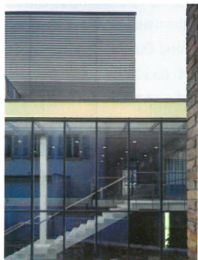
6 Théâtre du Passage, Théâtre régional de Neuchâtel Standort: Passage Maximilien-de-Meuron 4 Bauherrschaft: S.A.I.T.R.N., Stadt Neuenburg und 15 Gemeinden Architekten: ARGE Walter Hunziker/Anton + Chi Chain Herrmann-Chong, Bern Bauingenieur: GHV + N. Kostics, Saint-Blaise Wettbewerb: 1995, Fertigstellung: 2000–2001 www.theatredupassage.ch