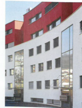
12 Wohngebäude «Crêt-Taconnet Est» Standort: Espace de l'Europe 13–20, Rue du Crêt Taconnet 13 und 19 Bauherrschaft: Helvetia Patria, Basel Architekten: Bauart Architekten und Planer AG, Bern/Neuchâtel; Mitarbeiter: Florence Mani und Robin Schori Bauingenieur: CVH Saint-Blaise, Pierre Gorgé Projekt: 2000–2001, Ausführung: 2002–2004 (Etappe 1), 2005–2007 (Etappe 2)