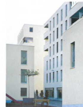
11 Städtisches Wohnquartier Crêt-Taconnet Standort: Rue du Crêt-Taconnet Bauherrschaft: SUVA, Luzern Architekten: Devanthery & Lamunière, Carouge; Mitarbeiter: L. Amella, C. Gaughran Generalunternehmung: Immoroc, Neuchâtel Bauingenieur: GVH Saint-Blaise SA Wettbewerb: 1997, Ausführung: 2002–2004