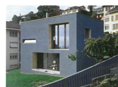
15 Villa Mazzucco Standort: Chemin de Bel-Air Bauherrschaft: Herr und Frau Mazzucco Architekten: Atelier d'architecture Manini Pietrini, Neuchâtel Bauingenieur: N. Kosztics, Neuchâtel Ausführung: 2004